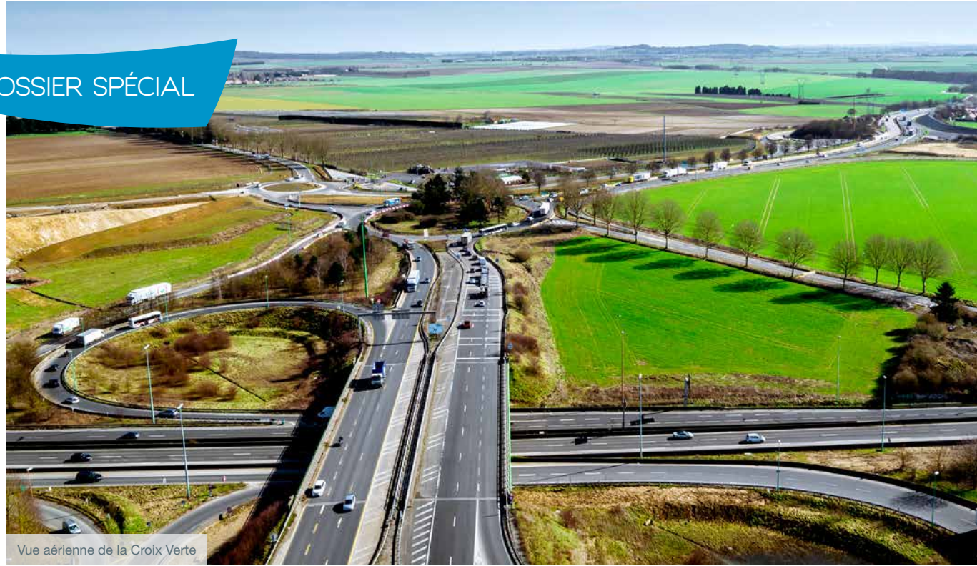
Vue aérienne de la Croix Verte