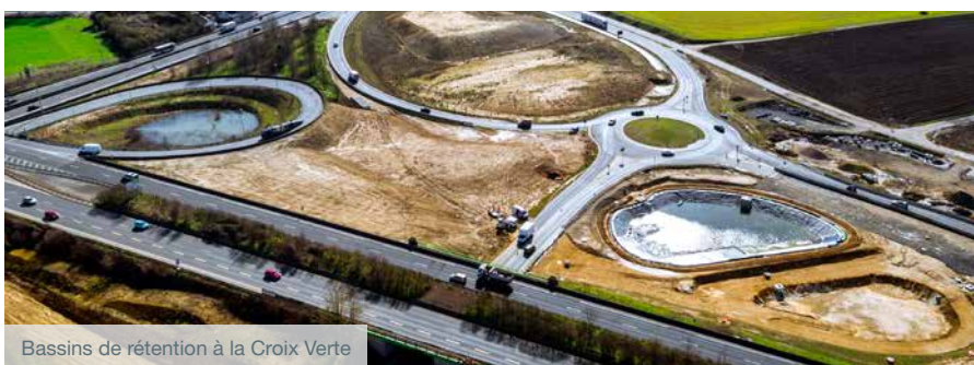
Bassins de rétention à la Croix Verte