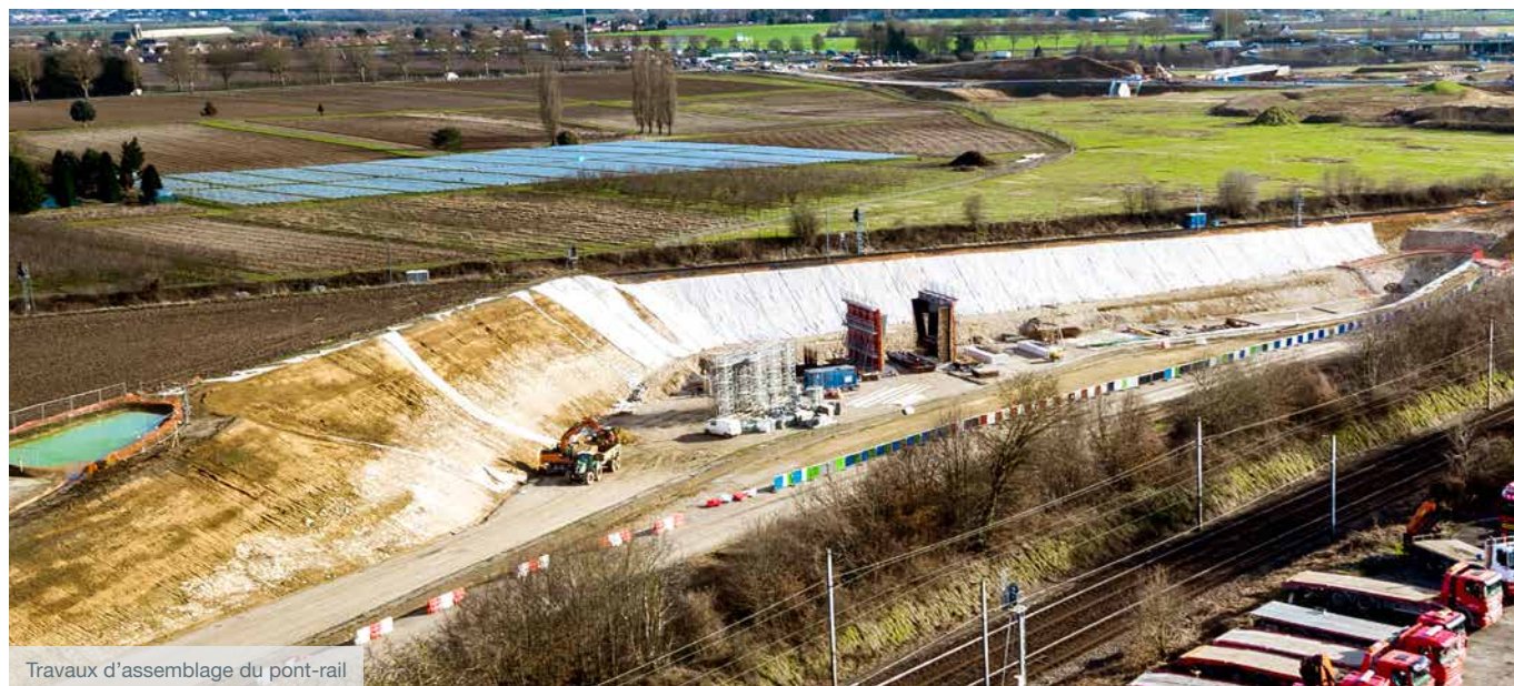
Travaux d'assemblage du pont-rail

Sanef, cette opération est conduite par SNCF Réseau. Le trafic ferroviaire sera interrompu entre le 14 juillet et le 15 août 2018 sur la ligne H, entre Montsoult et Luzarches. SNCF Réseau communiquera sur la mise en place de transports de substitution.