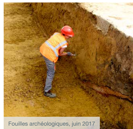
Fouilles archéologiques, juin 2017

L'occupation de cet habitat agro-pastoral, où l'on pratiquait probablement l'extraction d'argile pour la construction de murs en terre crue, aurait pris fin vers 130 avant J.-C. Le site est représentatif des fermes gauloises du nord de la France.