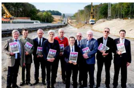
Signature de la charte du Bois Carreau, le 25 octobre 2017

Le Bois Carreau est situé à la jonction des forêts de Carnelle et de L'Isle-Adam. Le prolongement de l'A16 offre