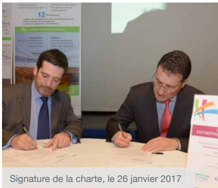
Signature de la charte, le 26 janvier 2017

Le 26 janvier 2017, Sanef a adhéré à la charte Entreprises et Quartiers avec l'appui de l'association Reflexes 95 qui fédère les acteurs locaux de l'emploi au plus près des besoins de 33 communes.