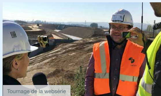
Tournage de la websérie