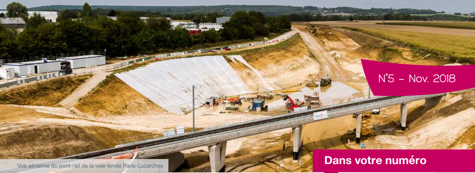
Vue aérienne du pont-rail de la voie ferrée Paris-Luzarches