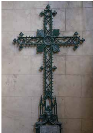
La croix verte en fonte de 1912

Bien avant de devenir l'un des nœuds routiers les plus importants du Val d'Oise, le carrefour de La Croix Verte était le lieu des processions des moissons et de la Fête-Dieu. Il est probable