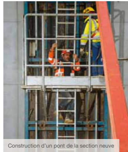
Construction d'un pont de la section neuve