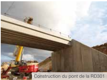
Construction du pont de la RD301