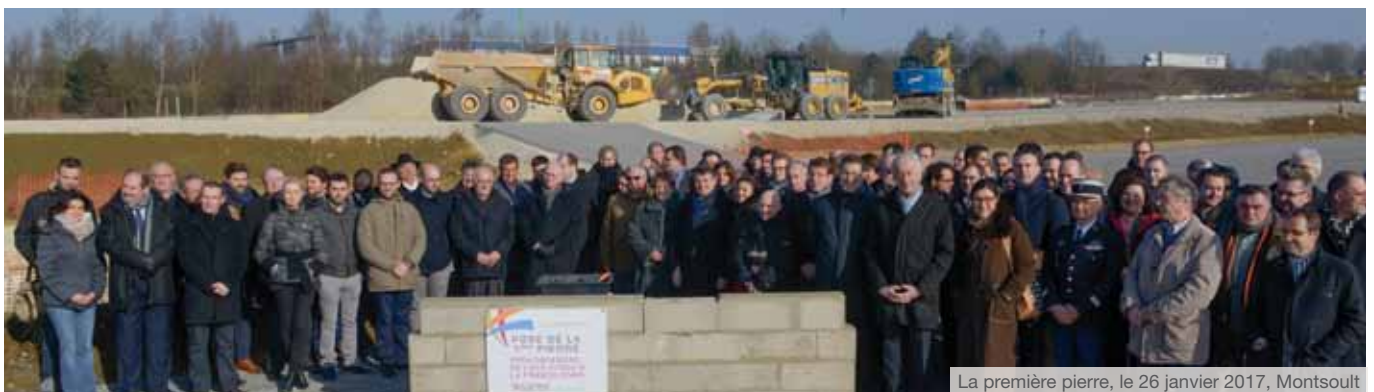
La première pierre, le 26 janvier 2017, Montsout