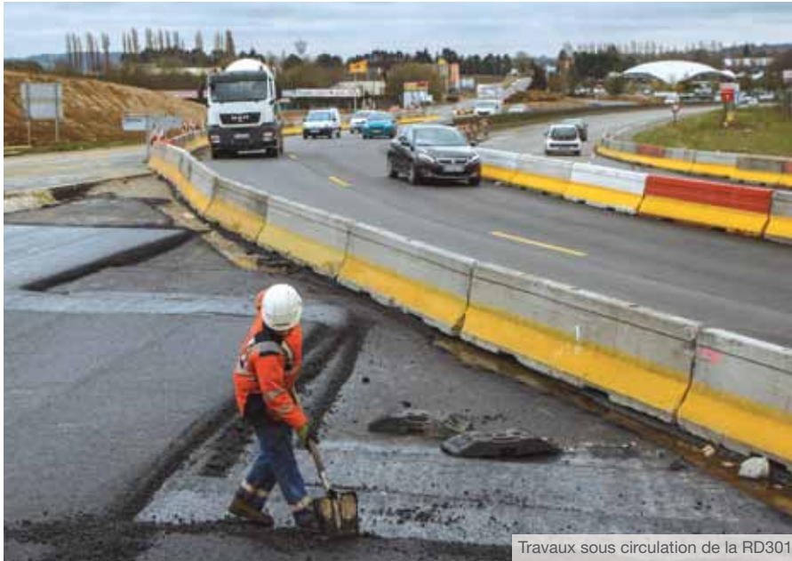
Travaux sous circulation de la RD301

La circulation est maintenue sur l'ensemble des axes jusqu'à la fin du chantier en 2019. Les interruptions nocturnes indispensables à l'avancement des travaux sont décidées en concertation avec les gestionnaires de voies : la Direction des Routes d'Île-de-France (DiRiF), le Conseil départemental et les communes.